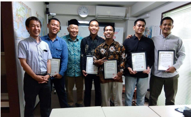
センターの卒業式にて