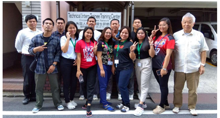
配属前にセンターの玄関前にて