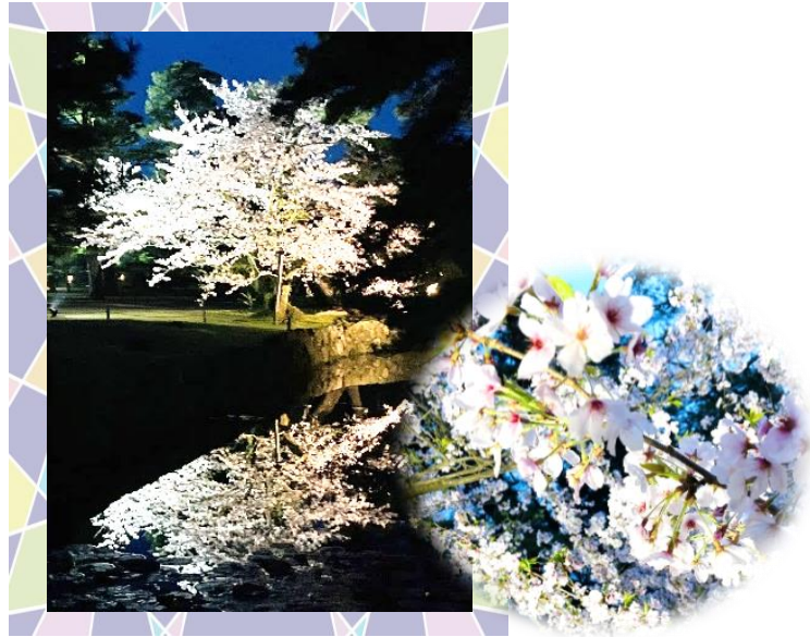
「特別名勝 栗林公園 春のライトアップ」 水面に鏡面反射する幻想的な景色は見事です！