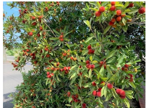
組合事務所入口のヤマモモ。 6月に入り、今年もあつという間に色づきました！