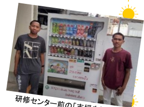
研修センター前の「支援自販機」 (高松市桜町)