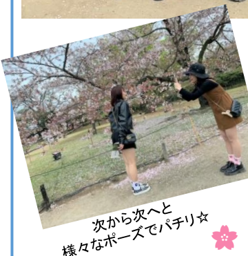
次から次へと 様々なポーズでパチリ☆

授業の合間の短い時間ではありましたが、思い出に残る楽しい時間を過ごせたようで良かったです。