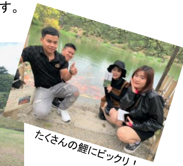
たくさんの鯉にビックリ!