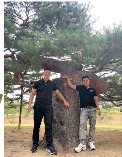
To be continued...