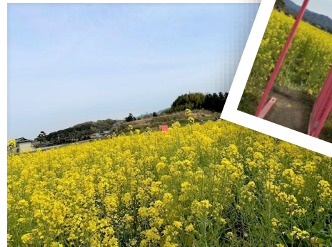
毎年夏になるとひまわりの名所になる「ひまわりの里まんのう」。 今の時期には、ひまわりの収穫後に種をまかれた菜の花で一面が黄色の菜の花畑になっていました。