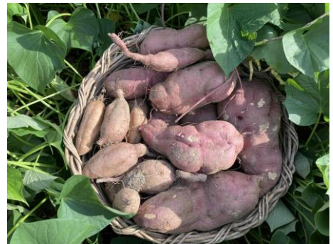
職員の実家の畑では薩摩芋がたくさん穫れました。季節の野菜や果物はとても美味しいですね！