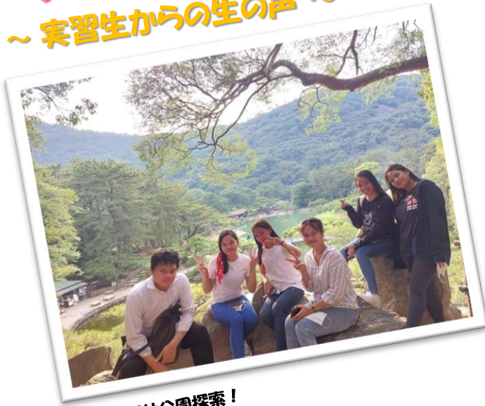
恒例の栗林公園探索！

入国後講習中の実習生が、 課外活動で出かけたときのことを書いてくれました。 ぜひ今後も仲間とともに、 日本の色々な観光名所に訪れてくださいね！