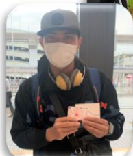
写真コンテストの賞品 QUOカード贈呈

「外国人技能実習生支援自動販売機」で飲み物を購入すると、1本につき5円の募金にご協力いただくことになり、 技能実習生の支援事業に役立てられます 。当組合決算月の7月末日現在の募金額は次のとおりです。