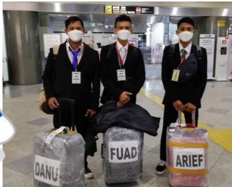
高松空港にて、インドネシアから入国した実習生。