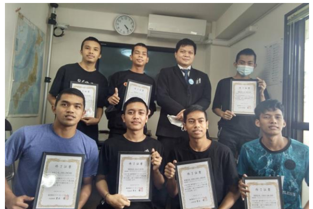
研修センター卒業式。 1ヶ月の入国後講習を終えると、各実習先の事業所へ配属されます。