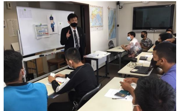
社会保険労務士による法的保護講習では、技能実習制度の仕組みや実習生の法的保護について勉強します。

入国後講習の一環として、恒例となった栗林公園散歩！広い園内を回りながら、日本ならではの様々な景色を堪能します。