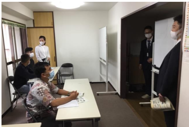
高松北警察署による生活安全講習では、交通安全マナーや防犯について学びます。