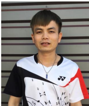
トンさん (ベトナム出身)

じかんがあつというまにすぎました。あつというまに15年ちかくになります。日本人、しゅうかん、おまつりについてのおもてがたくさんあり。私はここでよくのともだちにあいます。よいこともわるいことも。日本人はとてもフレンドリーでしつこくです。日本にきてから(会社名)にはたらいっています。しつこくとおくさんもとてもしつこくで、しごととせいかのなかで私をいっぱいてつづけてくれます。どうしようもとてもしつこくでフレンドリーです。みんなといっしょにしごとができて、とてもうれしいです。日本にたいざいするさかいかあれば、しばらく日本にたいざいしたいとおもっています。日本の国とひとびとにうんしゃします。どうもありがとうございます!へへ。