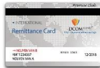
DCOM Remittance Card