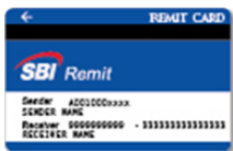
SBI Remit Card