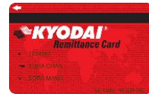
KYODAI Remittance Card