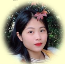
トウイさん (ベトナム出身)