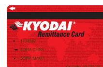
KYODAI Remittance Card