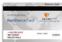
DCOM Remittance Card