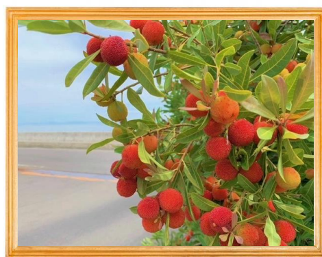
組合事務所(本部)入り口のヤマモモ。 毎年この季節に赤く色づきます。