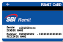
SBI Remit Card