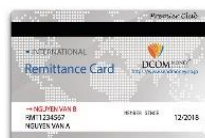
DCOM Remittance Card