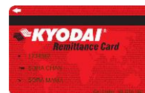
KYODAI Remittance Card

● Jangan transaksi jual beli (rekening bank beserta kartu ATM atau handphone) melalui sosial media.