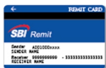
SBI Remit Card