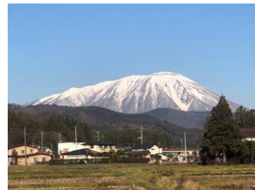
10月の初冠雪から2ヶ月が経ち、大分雪で覆われてきた岩手山です。(東北事務所)