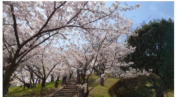
少林寺拳法発祥の地 金剛禅総本山少林寺の桜並木 (香川県仲多度郡多度津町)