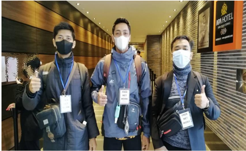
3月末にインドネシアから入国した実習生。 検疫所の宿泊施設から研修センターへ向かいました。

3月末および4月中旬、技能実習生がインドネシアとベトナムからついに入国しました！新型コロナウイルス感染症感染拡大の影響で2年以上も本国で待機していた実習生もあり、待ちに待った入国となりました。これまで新規の実習生が1年以上入国できない状況が続いていたので、