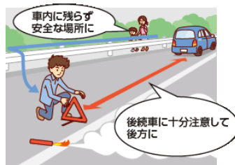
発炎筒、三角停止表示板等を後方に設置