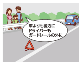
ガードレールの外側など安全な場所に避難