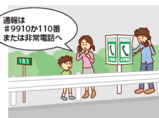
発生した故障・事故状況を通報