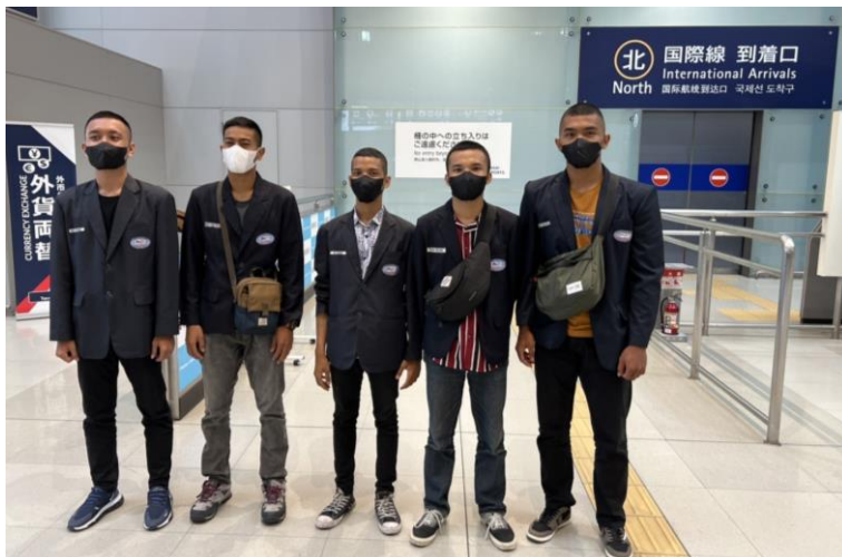
インドネシアから入国した実習生。現在は指定国解除となり検疫所の3日間待機も必要なくなりました。 到着時、関西国際空港にて記念の一枚！

https://www.anzen.mofa.go.jp/info/pcwideareaspecificinfo_2022C032.html (2022年4月6日時点)