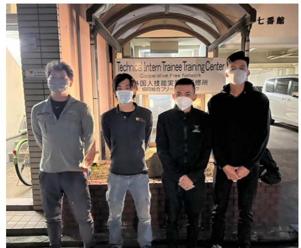
組合の研修センター前にて、 ベトナムから入国した実習生(右側2人)。 検疫所の宿泊施設で3日間の待機期間を終え、 研修センターに無事到着！ 実習先の方も実習生に会いにきてくれました。