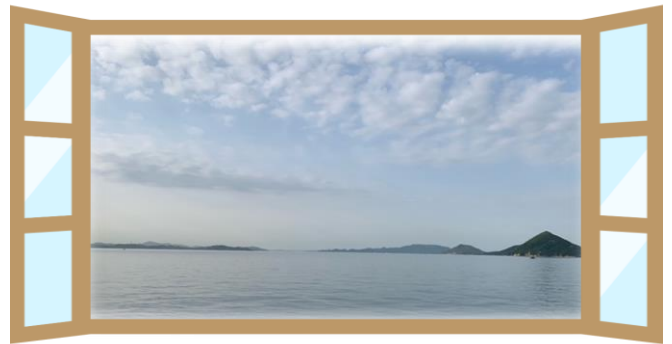
組合事務所(本部)の窓から見渡せる瀬戸内海