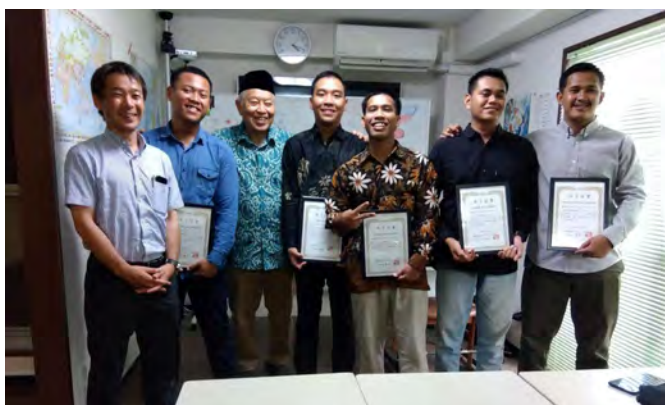
センターの卒業式にて