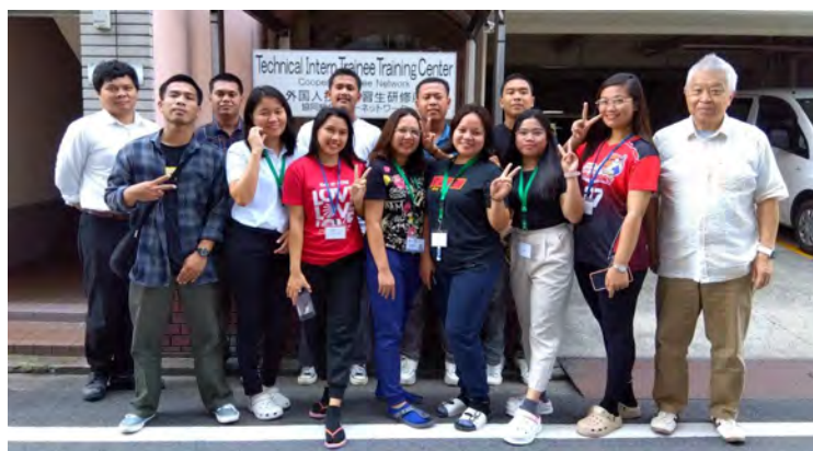
配属前にセンターの玄関前にて